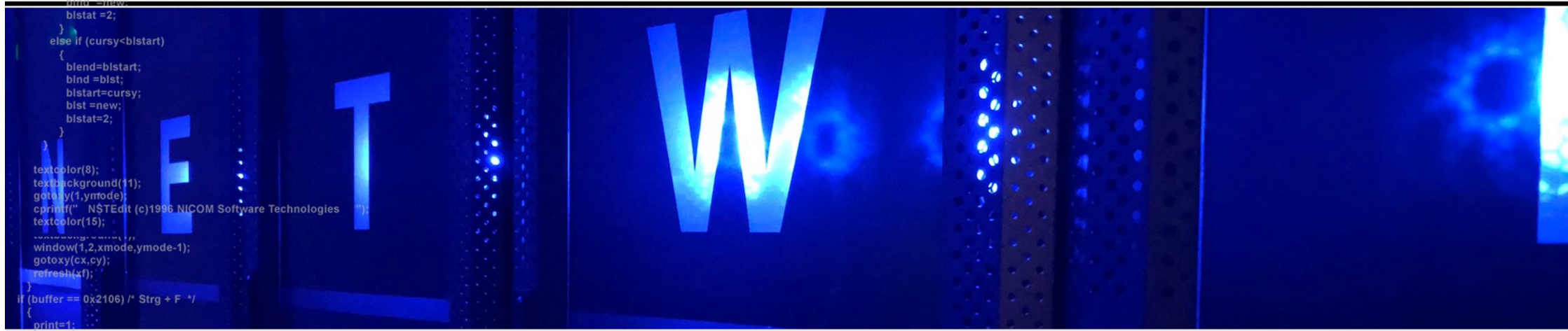
Geschäftsbericht zum Geschäftsjahr 2023 der NetWEB Systems AG